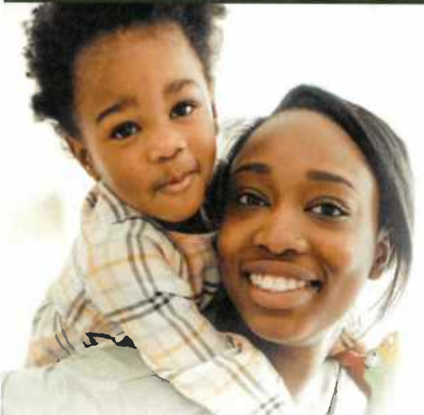
This project is supported by VDSS Solicitations for Employment & Training for TANF and Income Eligible Participants with funds made available to Virginia from the U.S. Department of Health and Human Services. Points of view or opinion contained within this document are those of the author and do not necessarily represent the official position or policies of VDSS or the U.S. Department of Justice/U.S. Department of Health and Human Services.